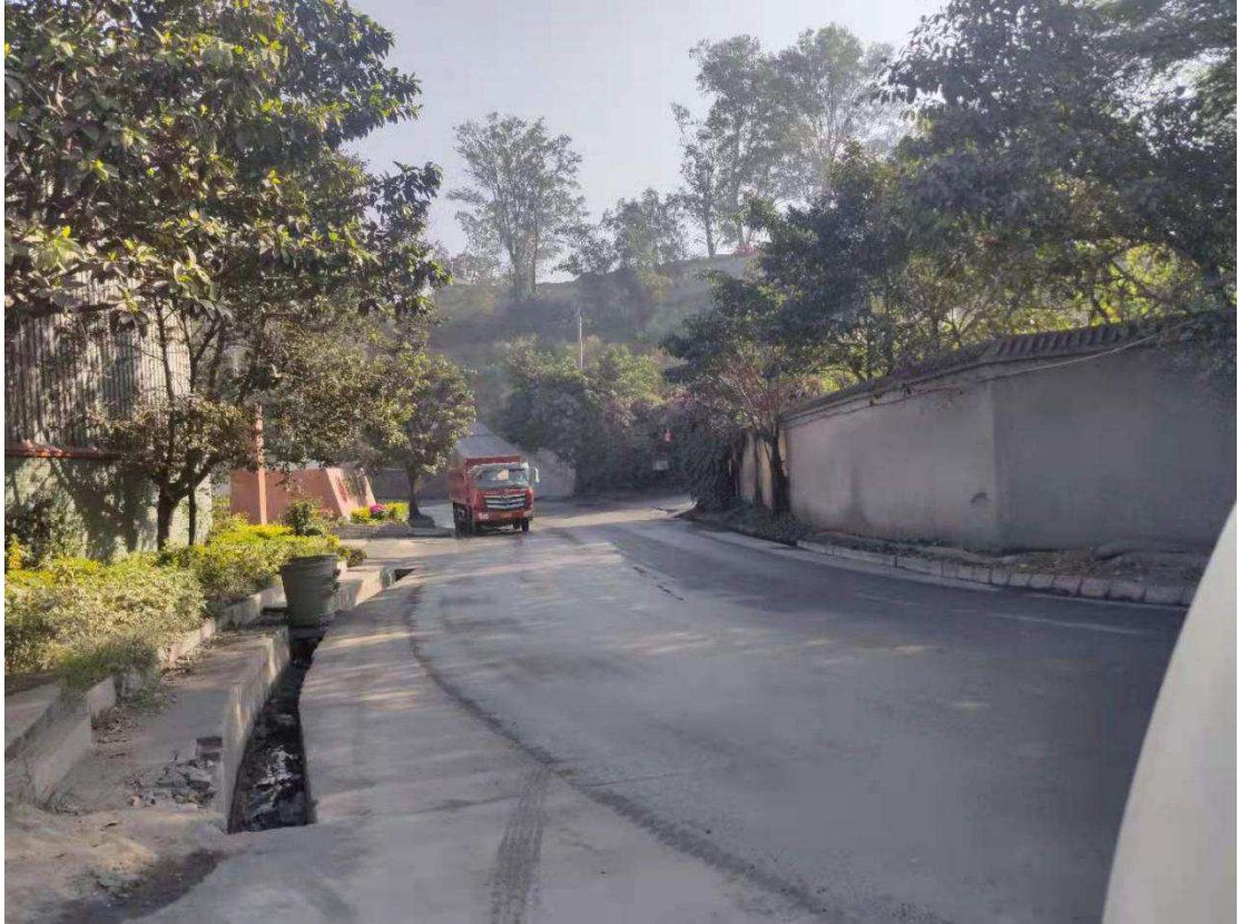
高粱坪园区公路冲洗后