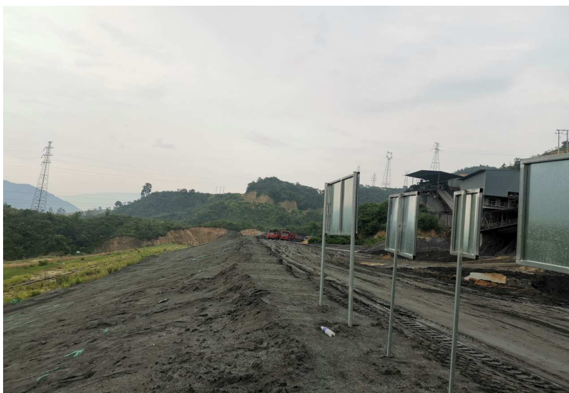
鑫慧矿业公司尾砂堆存场所（虹亦尾矿干堆场）