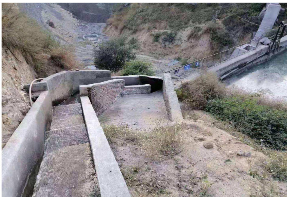
鑫慧矿业公司边沟