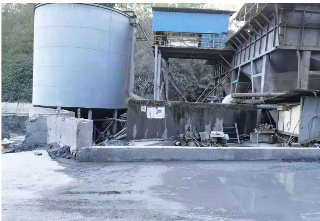
鑫慧矿业公司锥形浓缩斗