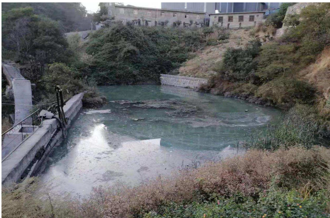
鑫慧矿业公司应急池