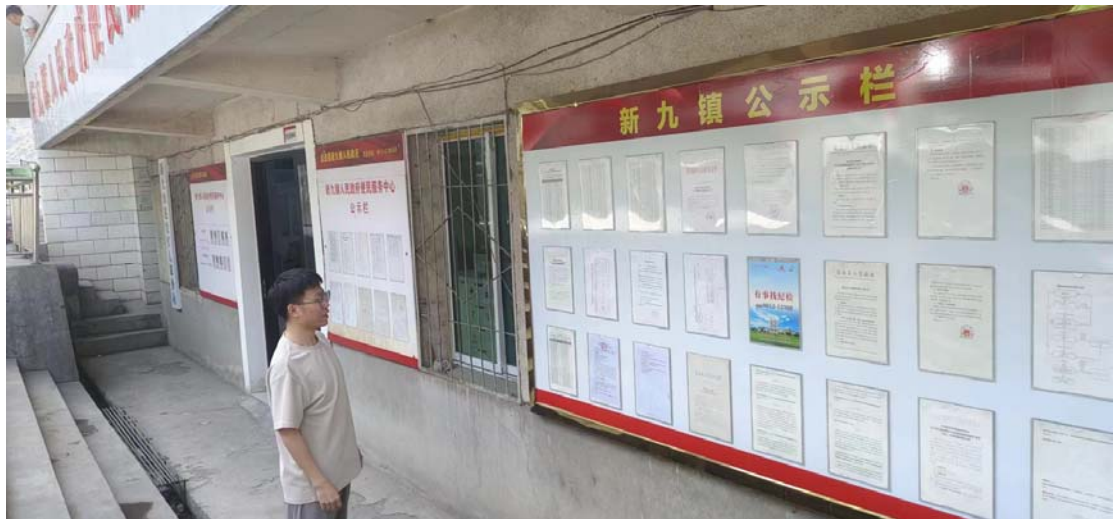
现场张贴公示（新九镇）