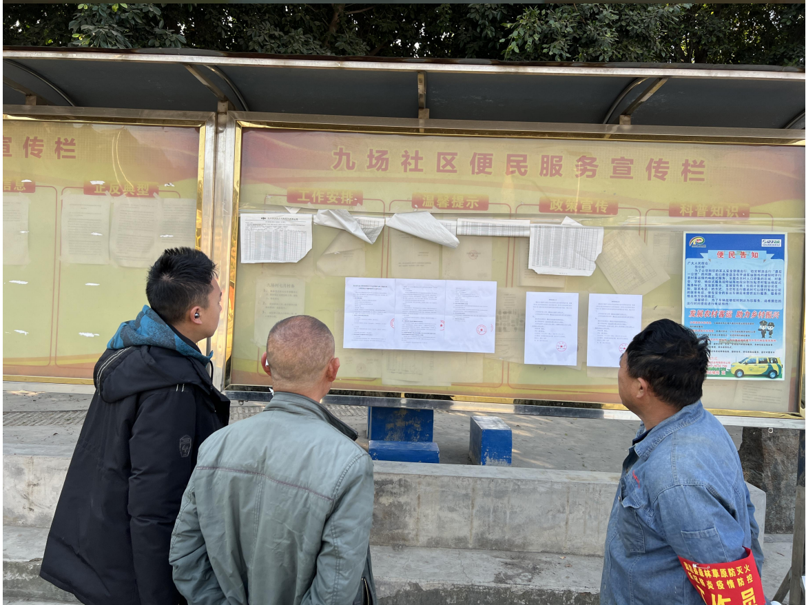
九场社区公告栏处张贴公示