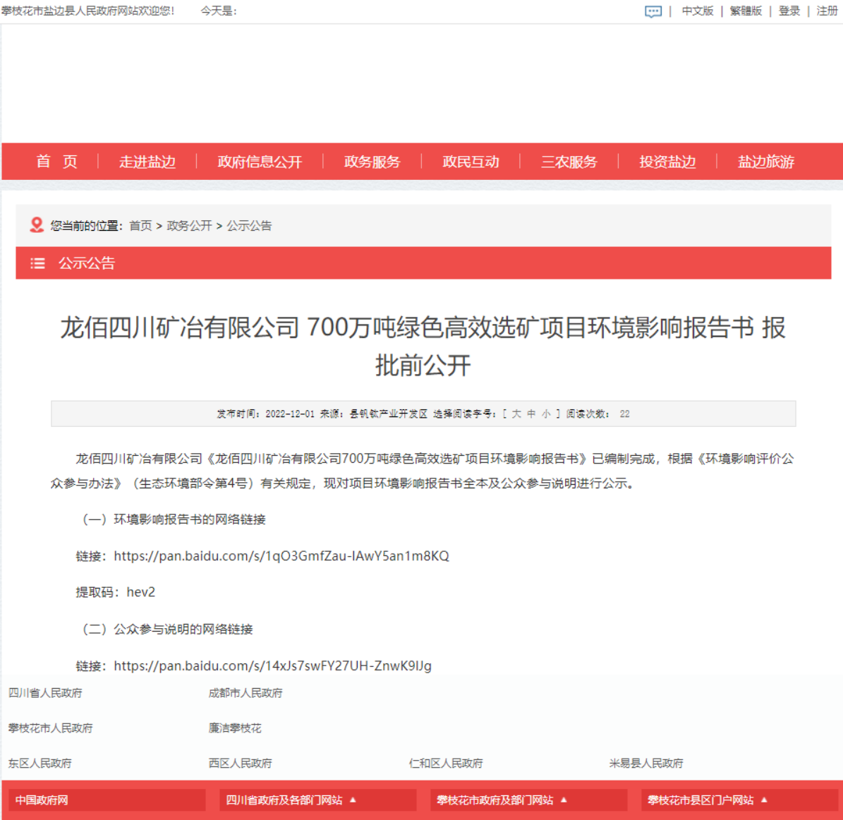
图 6-1 报批前公开网络公示截图