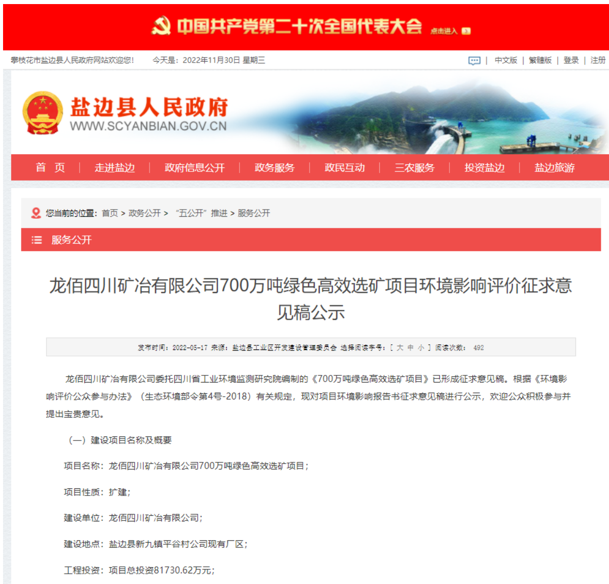
图 3-1 征求意见稿网络公示截图