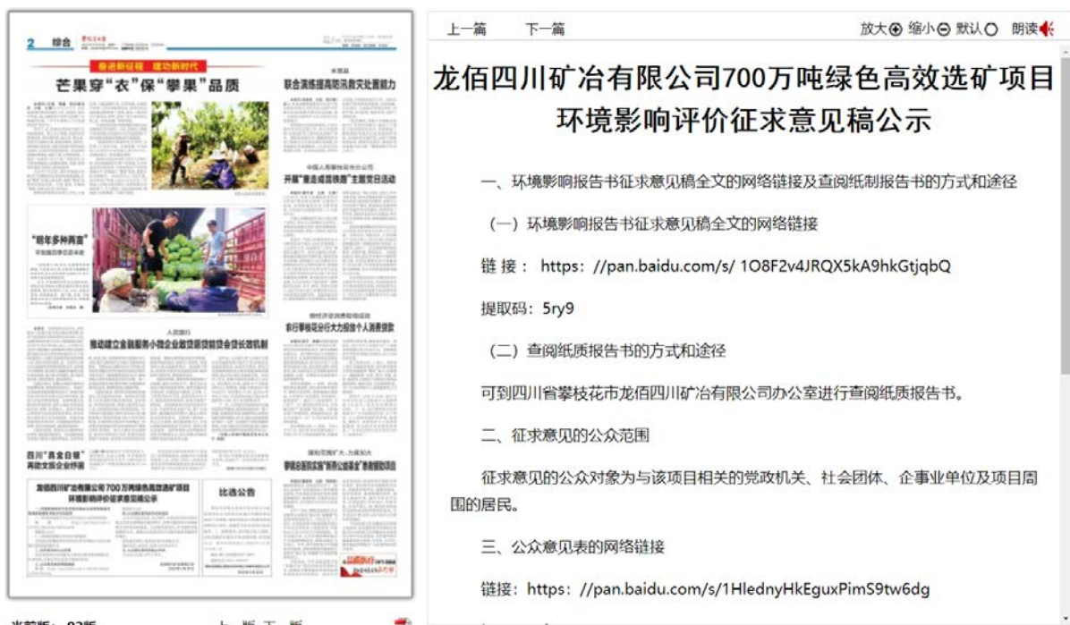
图 3-2 5 月 30 日攀枝花日报刊登内容