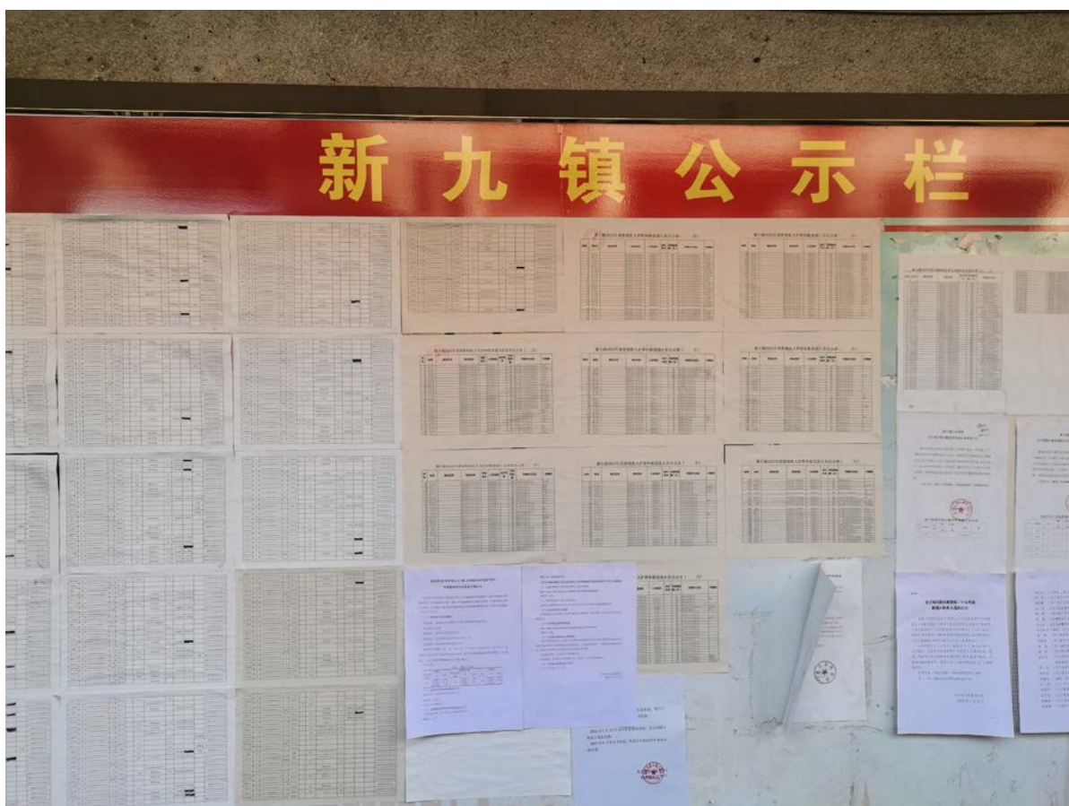
图 3-4 张贴公示