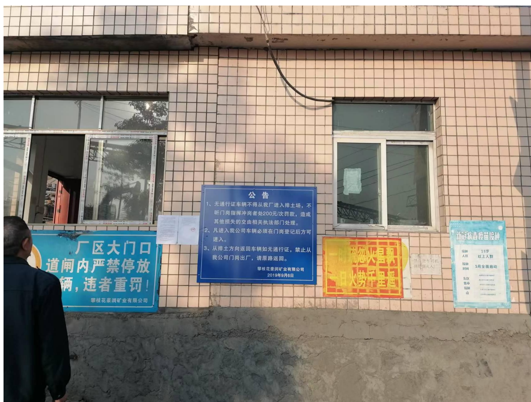
图 3-9 豪润公司厂区大门张贴照片