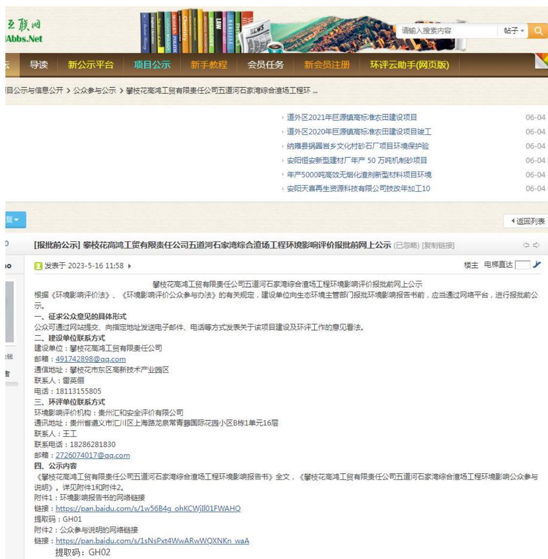
图 6-1 报批前公开网络公示截图