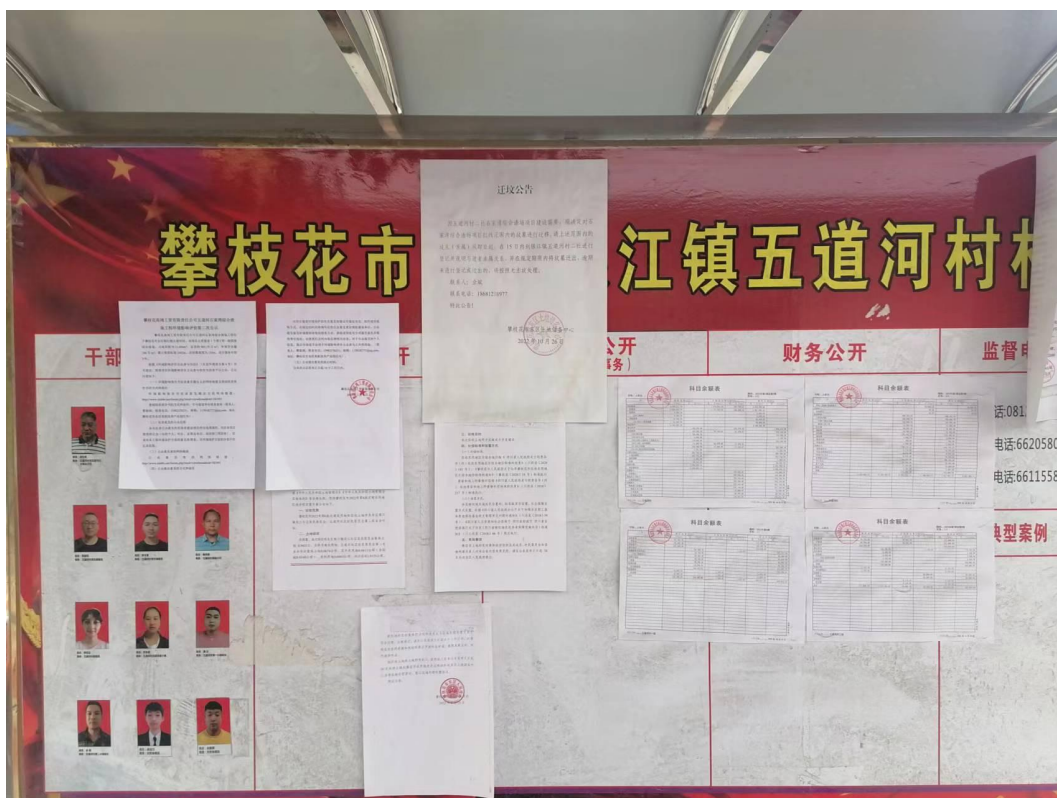
图 3-8 五道河村公示栏张贴照片