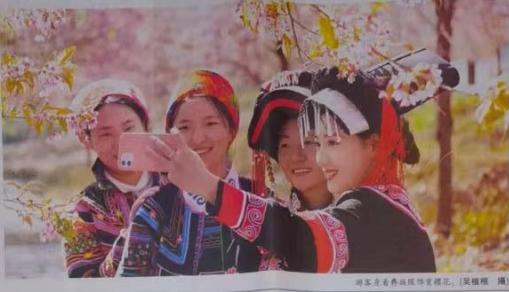
游客在麻陇乡赏花。

桃花盛开,吸引了众多游客前来观赏。桃花盛开,吸引了众多游客前来观赏。桃花盛开,吸引了众多游客前来观赏。