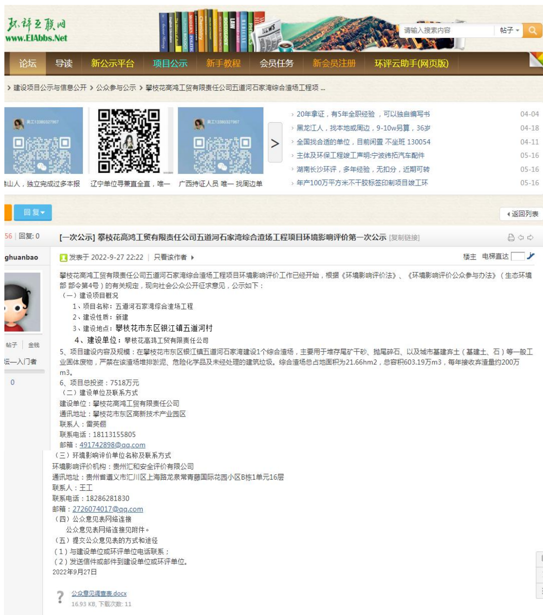
图 2-1 项目首次环境影响评价信息网络公示截图