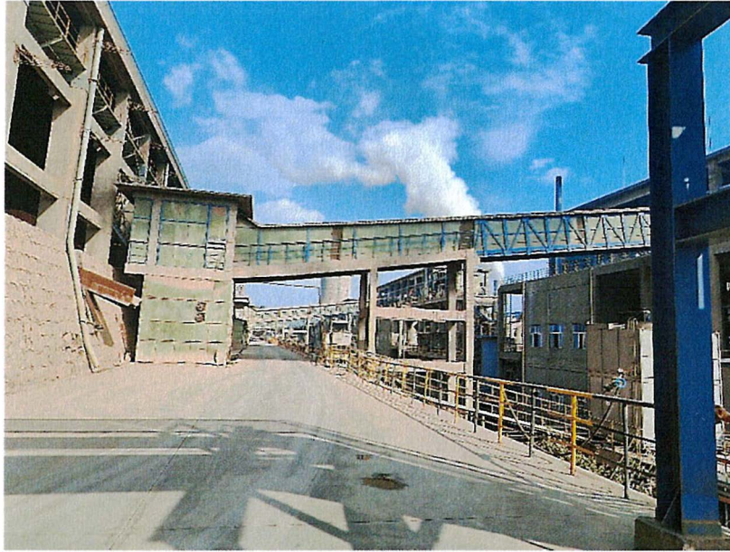
整改工作内容情况一览表