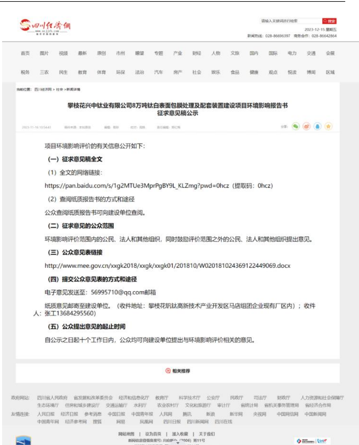
图 3-1 征求意见稿网络公示截图