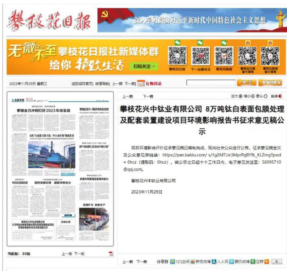
图 3-3 第二次攀枝花日报刊登内容