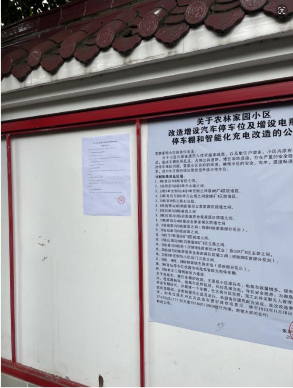
图 3-4 园区公告栏张贴情况

见稿公示期间在攀枝花兴中钛业有限公司园区公告栏进行了张贴公示，公示情况如图3-5所示。