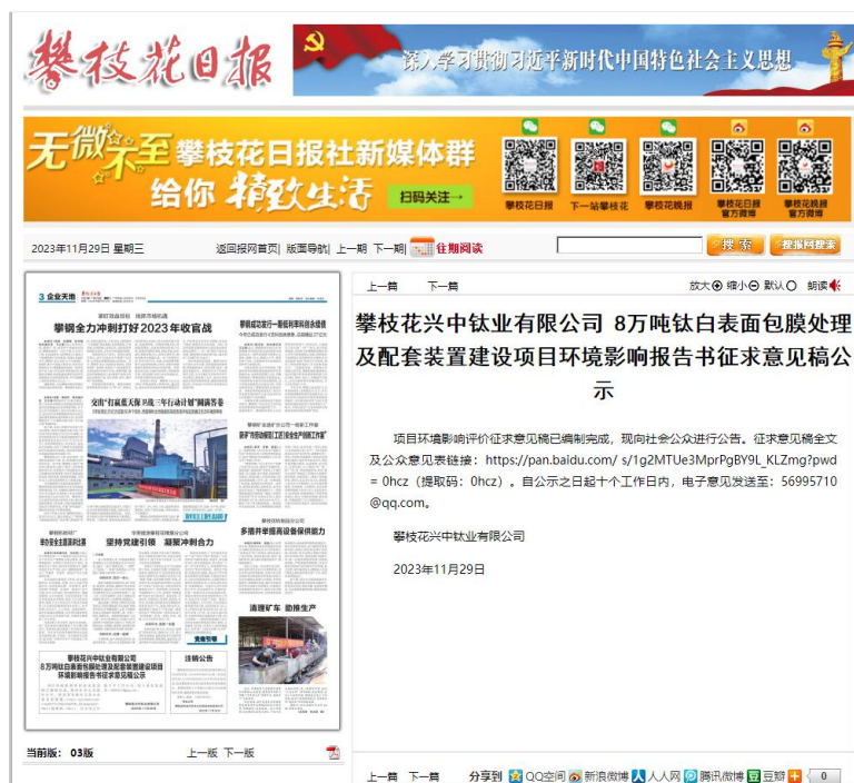
图 3-2 第一次攀枝花日报刊登内容