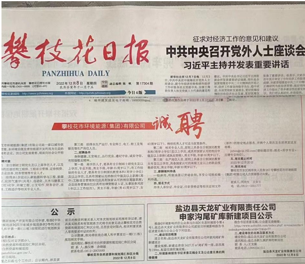
图 3-5 第二次登报公示