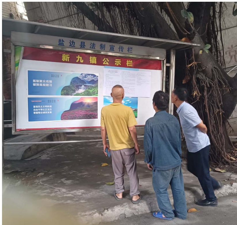
现场张贴公示（新九镇）