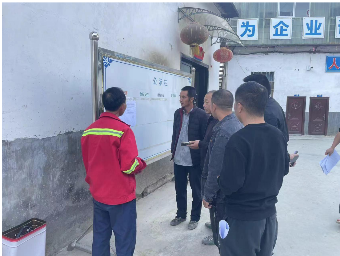
图 3-6 项目张贴公示（项目厂区公示栏）