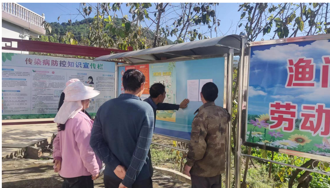
图 3-7 项目张贴公示内容（双龙社区）