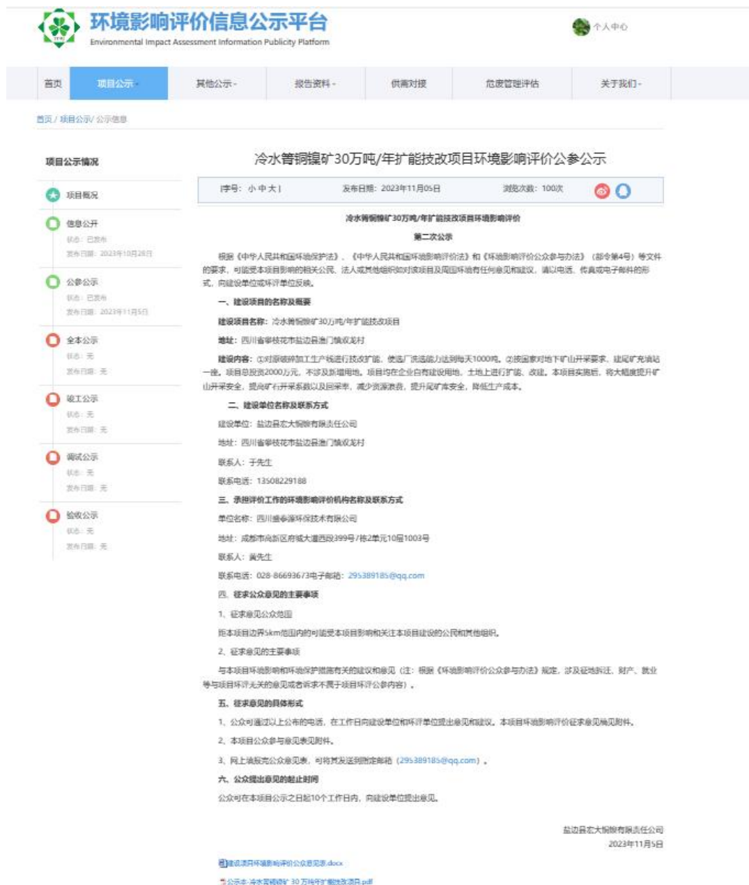
图 3-1 第二次公示截图