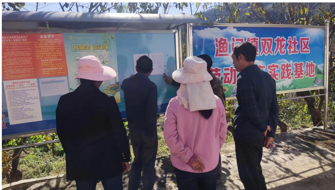
图 3-7 项目张贴公示内容（双龙社区）