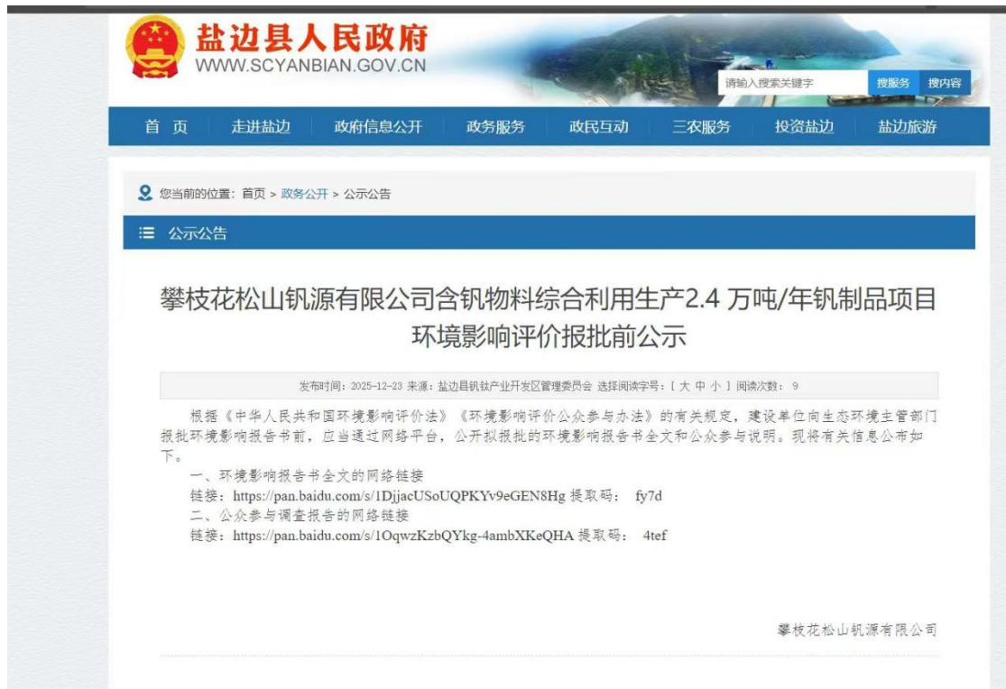
图 7-1 报批前公开网络公示截图