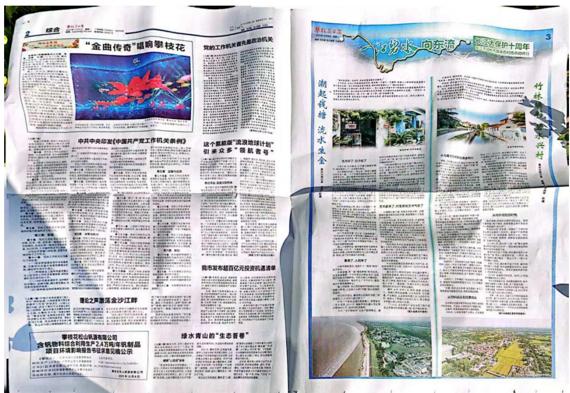
图 4-3 2025 年 12 月 8 日刊登内容