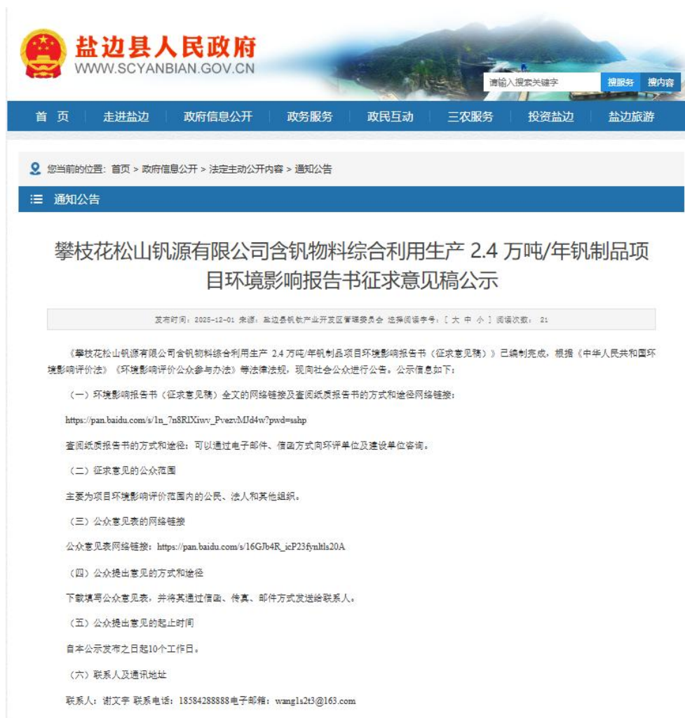
图 4-1 本次环境影响评价征求意见稿公示网页图片