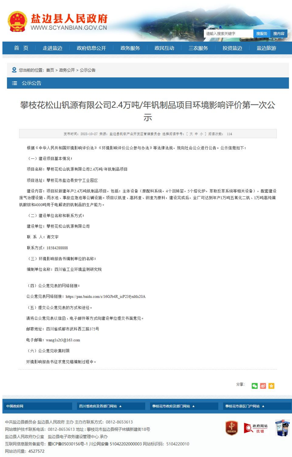
图 2-1 本次环境影响评价首次环境影响评价信息公示网页图片

本次环境影响评价于 2025 年 10 月 27 日开始在攀枝花盐边县人民政府网（ http://www.scyanbian.gov.cn//zwgk/gsgg/10248470.shtml ）进行了首次环境影响评价信息公示，公示内容见图 2-1。