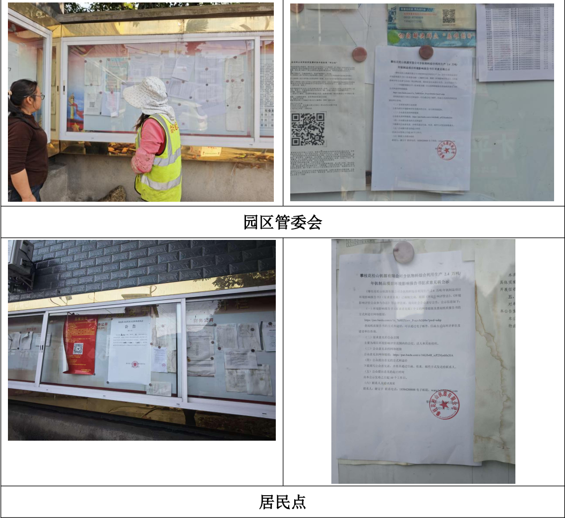
图 4-4 张贴公示情况

本次环境影响评价将报告书的主要内容、全文的网络链接、公众意见表下载链接等于 2025 年 12 月 3 日在园区管委会以及居民点公告栏处进行了张贴公示。公示情况见图 4-4 所示。