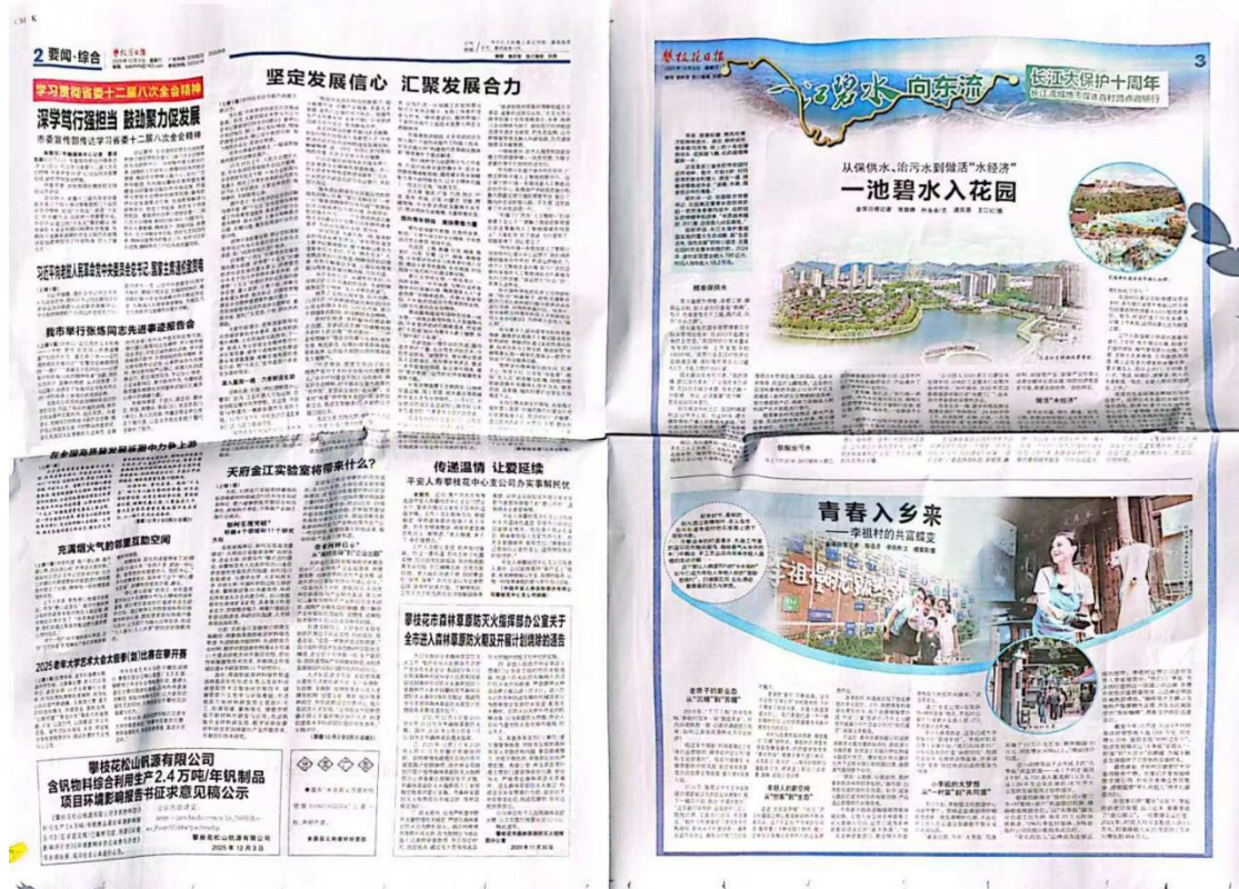
图 4-2 2025 年 12 月 3 日刊登内容