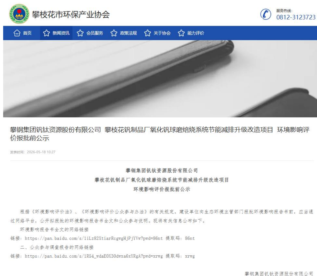
图6-1 报批前网络公示情况

http://www.pzhapi.com/nd.jsp?id=314 。报批前网络公示截图如下：