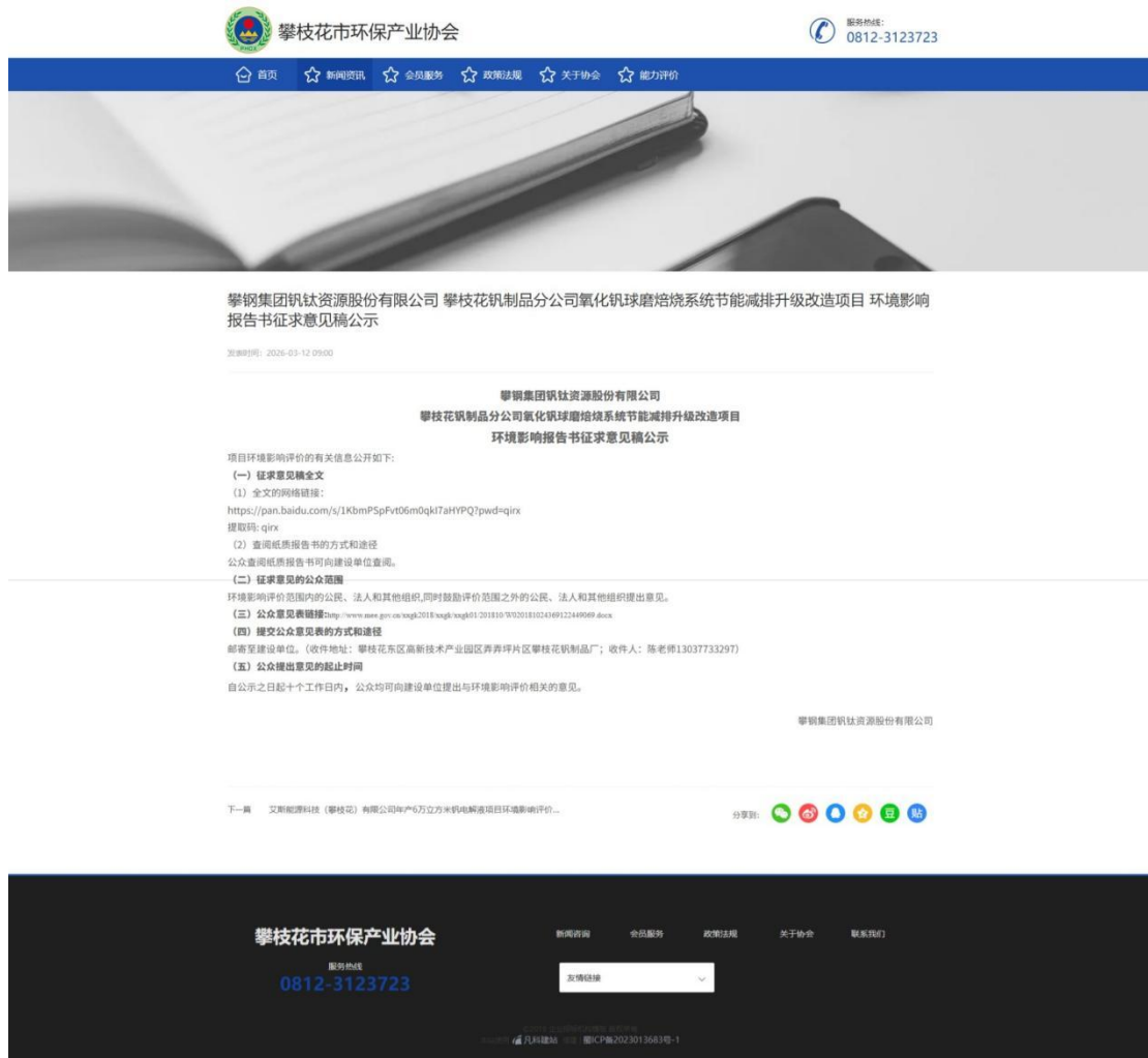
图3-1 征求意见稿网络公示截图