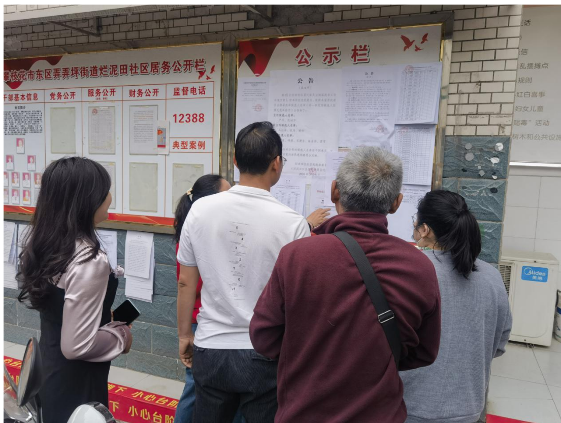
图 3-4 烂泥田社区公示栏张贴公示照片