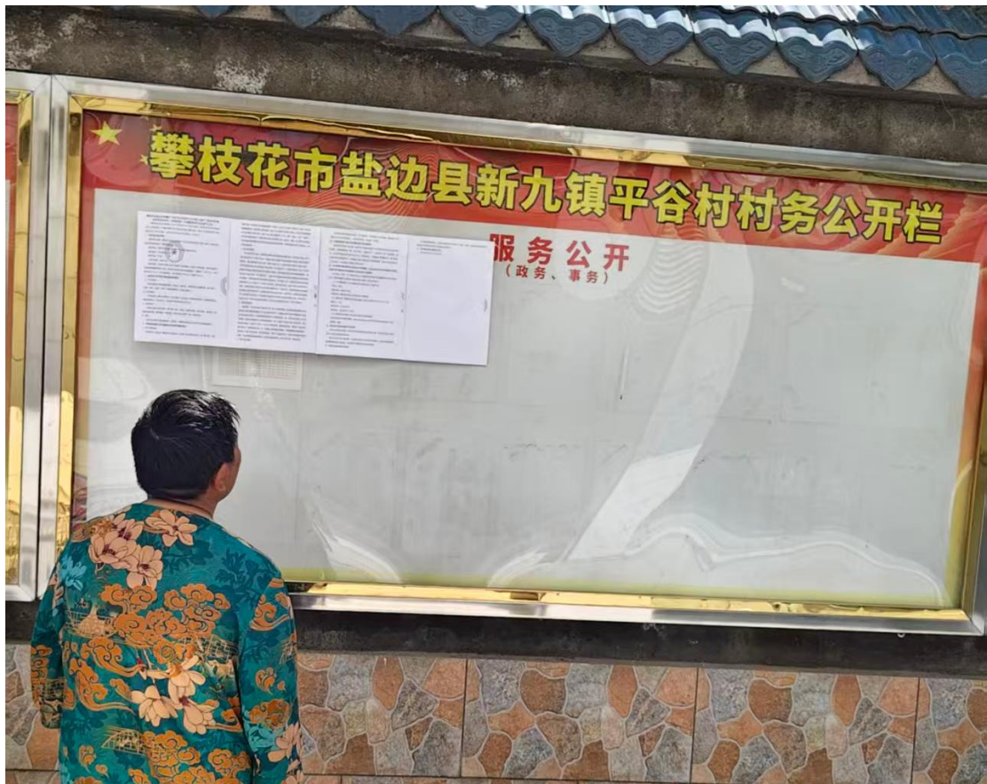
现场张贴公示（新九镇平谷村）