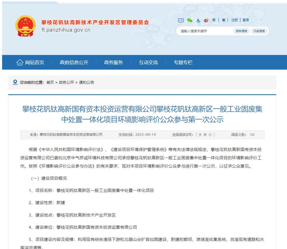
图 1 第一次网络公示截图

项目所在地为攀枝花钒钛高新技术产业开发区，攀枝花金江固体废物治理有限公司在攀枝花钒钛高新技术产业开发区管理委员会网站进行了网络公示，该网站为对外公开、易于公众接触及阅读的官方网站。网址为： http://ft.panzhuhua.gov.cn/zwgk/tzgg/4516286.shtml 以下为公示截图：