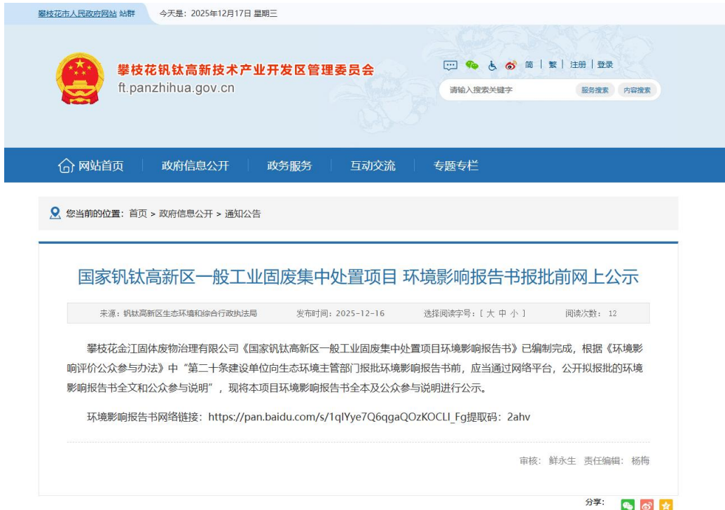
图 5 报批前公示截图

按照《环境影响评价公众参与办法》要求，本项目于2025年12月16日在攀枝花钒钛高新技术产业开发管理委员会网站（ http://ft.panzhuhua.gov.cn/zfxxgk/tzgg/10259881.shtml ）上进行了报批前公示，公示内容包括本项目环境影响报告书全本及公众参与说明。