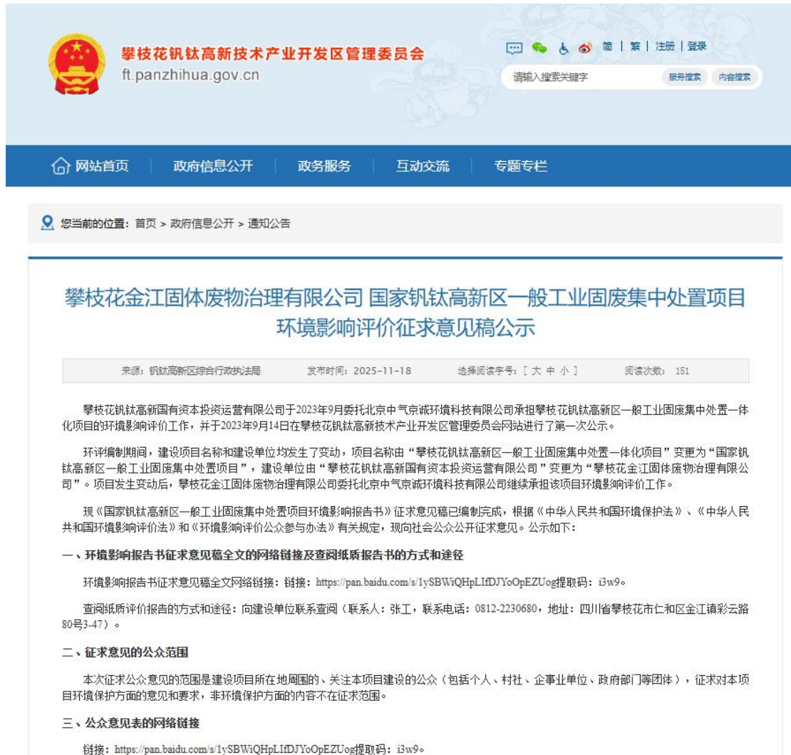
图 2 第二次网络公示截图