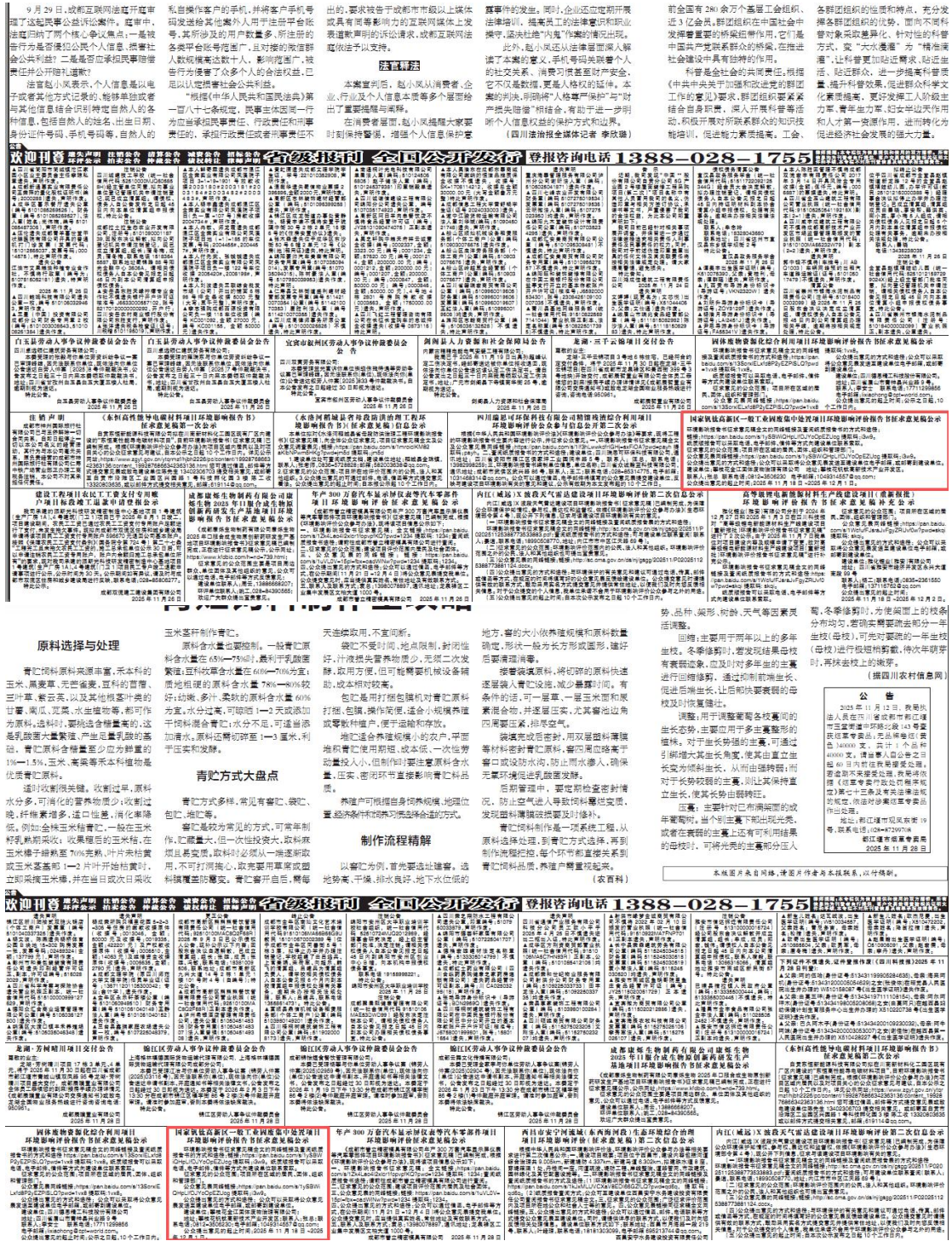
图 3 报纸公示照片

攀枝花金江固体废物治理有限公司通过公众易于接触的报纸公开，于2025年11月26日和2025年11月28日在四川科技报进行了2次公示。公示登报情况如下图所示：