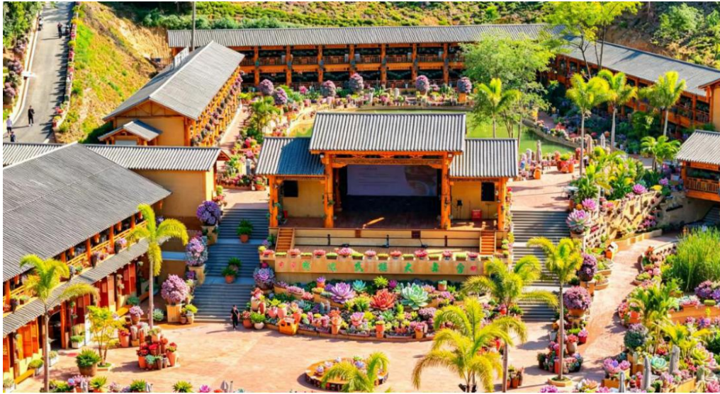
图5 芋见·张宜花园多肉植物餐厅一角

规模达3.9万亩，2025年产量2.28万吨，产值3.2亿元，以金芋健公司为代表的龙头企业，已形成集品种选育、技术指导、产品研发、精深加工、品牌销售于一体的完整产业闭环，真正实现了“一个龙头带活一片、一个产业富了一方”的联动效应。