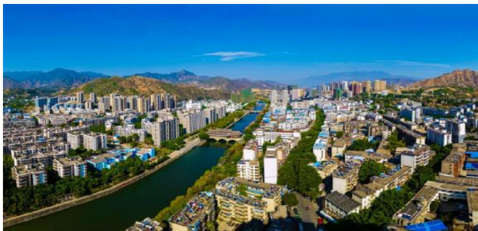
图1 大河（仁和城区段）俯瞰图

仁和区作为攀枝花市“钒钛新城、攀西科技城”建设核心承载区，立足区位特色和资源禀赋，坚持以水定城、以水兴城、以水美城，把大河流域综合治理作为提升城市品质、补齐功能短板、增进民生福祉的战略性抓手，一体布局生态保护、休闲游憩、运动健身、文化展示、科普宣教多元功能，通过系统治水、全域造景、业态赋能、服务提质，城市颜值显著提升、功能配套持续完善、人居环境持续优化、康养魅力持续彰显，全力打造特色鲜明、宜居宜游、业兴人和的城市滨水文化风貌样板区，为攀枝花擦亮“阳光花城、康养胜地”名片，建设“宜人新城、产业新区”提供了坚实支撑。