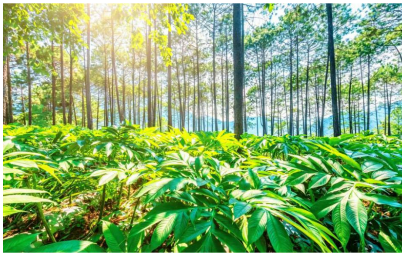
图2 盐边县永兴镇箐河村松林坪基地林下魔芋种植基地

立足当地立体气候和森林资源优势，以金芋健公司为龙头，示范推广“桉木林+魔芋”“木本油料+魔芋”等立体复合种植模式，建设标准化示范基地，开展绿色种植技术推广。建成魔芋精深加工生产线，开发魔芋膳食纤维颗粒、魔芋日化用品、魔芋米等60余类系列产品，构建品种选育、技术指导、加工研发、市场销售一体化产业体系，带动农户参与规模化种植。