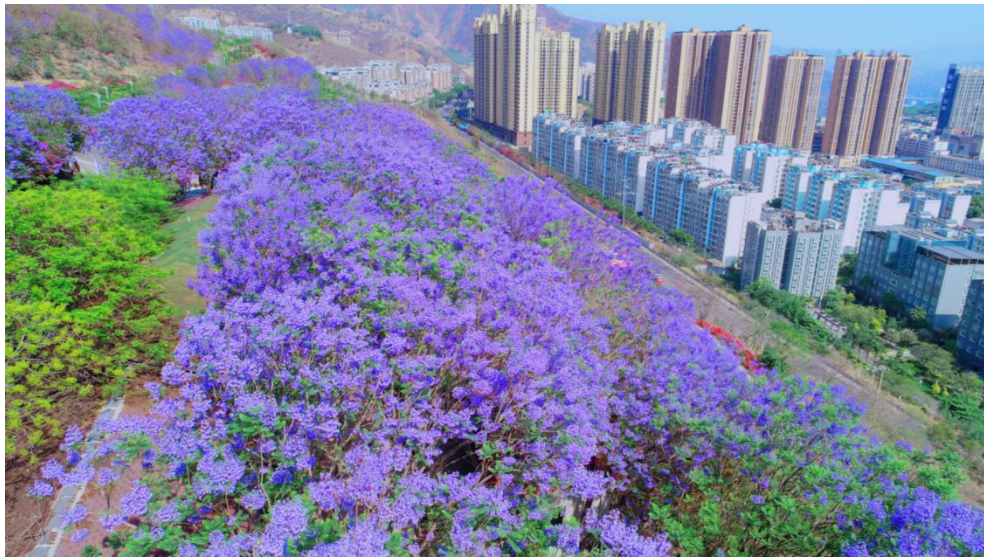
图2 西佛山蓝花楹

精准监管，推动生物多样性保护工作法治化、智慧化。在城市近郊石漠化区域，取缔污染企业28家、非法堆场16家，累计清理固体废弃物200余万吨，创新实施“环境整治+生态修复+景区打造”的“西佛山模式”，建成国内最大的人工蓝花楹园林，让昔日的工矿废弃地变身为市民的“生态绿肺”和城市后花园。水墨金沙项目以山水林田湖一体化修复为抓手，科学治理沿江荒地、荒坡、荒滩，恢复湿地功能，新建生态护岸与滨水生态廊道，通过“点-线-面”结合的系统治理，将生态短板转化为文旅发展优势。