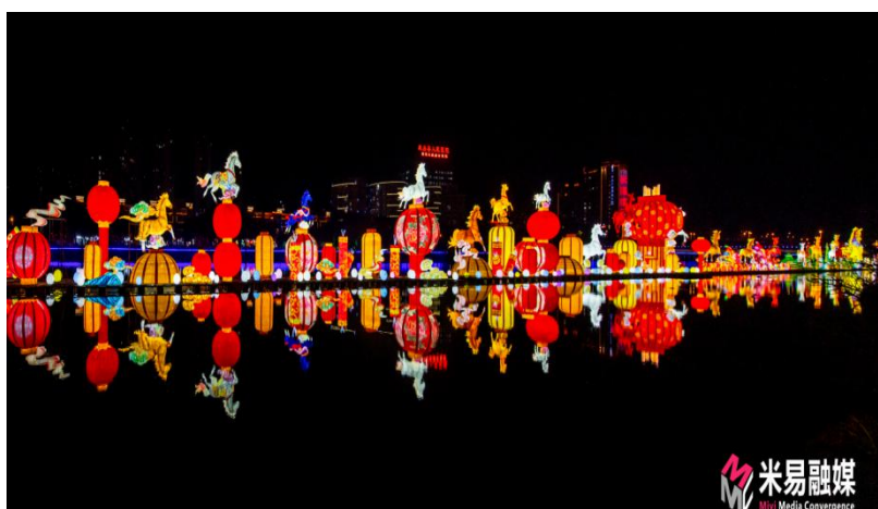
图5 第十七届米易灯会

坚持把保护和改善生态环境作为首要任务,同步实施景区基础设施建设和绿化美化,系统推进水功能区划、河道蓝线保护、河道综合整治,实施草场河水系连通、安宁河干热河谷生态修复、南部新城滨河生态修复等水生态保护项目,实现了“水清、河畅、岸绿、景美”。全面落实河(湖)长制、林长制,建立了网格化、智慧化、常态化的河长制监督管理网络平台,推动景区巡查、治理全覆盖、无死角,景区生态环境质量持续改善。