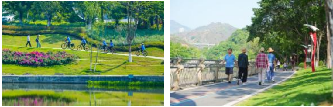
图4 仁和区滨河健身步道（大河沿岸）

（三）立足区位优势，串珠成链做强康养文旅。 仁和区位于攀枝花市南部、川滇结合部，境内有攀枝花高铁南站，是川滇交界物资集散地，是攀枝花城市核心区向南拓展的主要区域，是重要的交通枢纽，在产业支撑、空间拓展、综合承载能力等方面优势明显。流域区域发展齐头并进，与现有普达阳光国际康养度假区、苴却砚文化旅游区、苴却砚博物馆、三线建设博物馆等景点融合，打造成集“城市客厅、文化街区、康养公园”为一体的城市康养休闲文旅带。