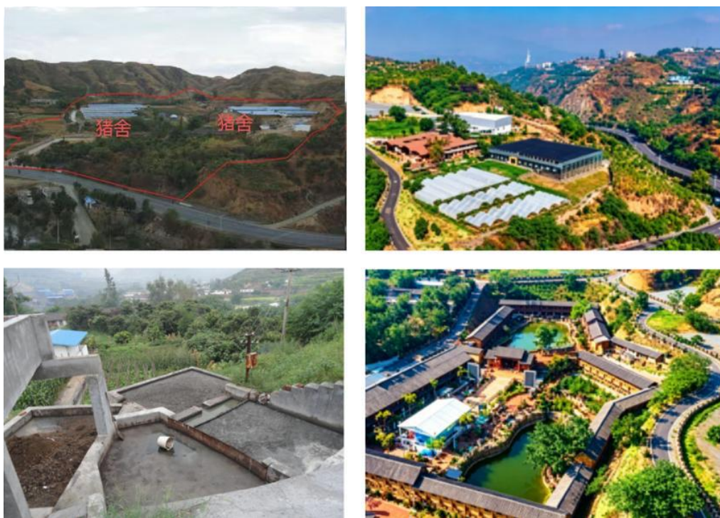
图4 养殖场（左）转型金芋健魔芋三产融合示范产业园（右） 前后对比图

通过“修复+利用”模式，原养殖场区域土壤板结、水体富营养化等问题得到根本解决，周边水体水质从劣V类稳定提升至Ⅲ类，土壤有机质含量回归正常。原址建成集种质保护、科技示范、生态观光于一体的现代农业公园核心区，配套打造的芋见·张宜花园餐厅等特色节点，成为盐边县生态修复与绿色发展的标志性样板及网红打卡地。