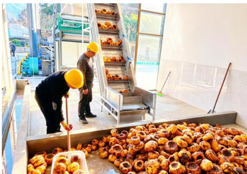
图3 盐边县国胜乡魔芋初加工基地

推行全产业链联农带农机制、全链条收入分配机制。通过“企业+标准+农户”模式，将传统农民转型为技术型产业工人和股东，实行三重保障体系。实行价格托底，企业既推广良种和种植技术，又向农户承诺保底回收价格。实行奖补激励，企业设立“魔芋产业共富基金”，奖补高产先进种植户，让种植户共享公司红利。实行股权共持，魔芋全产业链员工均持有股份，员工持股比例达34%(最大股东群体)，实现“资源变资产、资金变股金、农民变股东”。