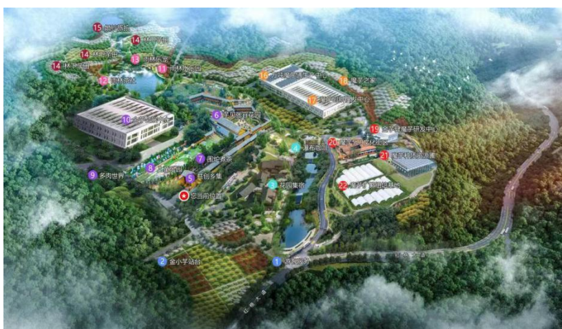
图1 金芋健魔芋三产融合示范产业园总平面布置图

盐边县红格镇原“龙腾四海”养殖场，长期采用传统畜禽养殖模式，污染治理设施建设滞后，存在粪污处置不完善、土地承载力饱和、污染周围水体等突出环境问题，成为区域生态环境短板。面对生态红线硬约束与高质量发展新要求，盐边县立足63.86%森林覆盖率、立体气候、山地资源优势，以美丽攀枝花建设为抓手，推动养殖场关停转型，对原址进行生态修复再利用，于2023年引进四川盐边金芋健生物科技有限公司（下称“金芋健公司”），打造以魔芋为核心的林下经济全产业链，走出一条生态修复+绿色产业+农文旅融合+联农共富的转型路径，实现从“污染型”向“绿色型”“单一养殖”向“全链融合”的根本性转变，把生态环保压力转化为产业升级动力，将生态优势转化为发展优势。