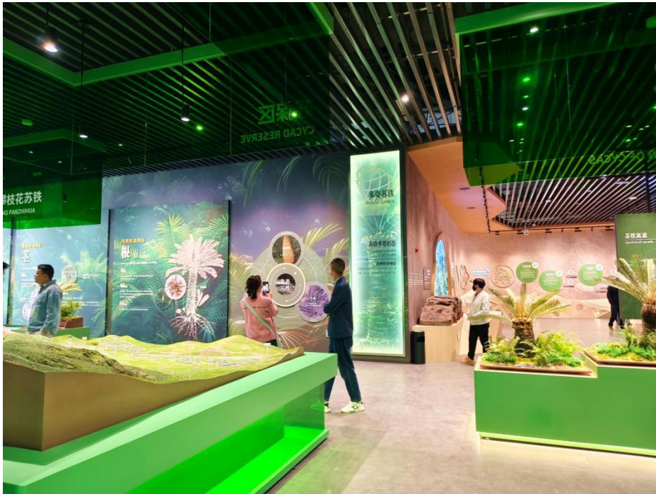
图3 苏铁科普展示馆

市民微度假首选地、“亲水赏花、共享清凉”网红打卡地，全方位提升区域文旅品牌影响力。依托国家级苏铁自然保护区这一独特资源，打造以苏铁为主题的科普、研学、生态旅游项目，在苏铁保护区入口建设现代化科普展示馆，运用声光电技术系统展示攀枝花苏铁的起源、演化与保护价值，成为市民和游客了解这一“植物活化石”、增强生态保护意识的重要科普教育平台。将苏铁元素融入城市公园、绿地、标识等景观设计，彰显城市与珍稀植物和谐共生的生态特色。