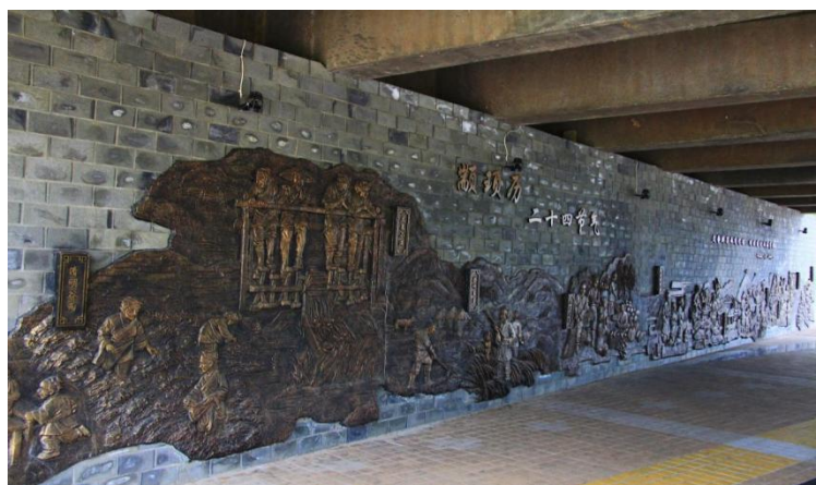
图3 米易县颍项历史文化墙

全力推进水利风景区建设与文化发展良性互动，深入挖掘颍项文化、农耕文化、法治廉政文化，将文化元素融入规划和建设中，先后建成农耕文化园、颍项文化墙、法治廉政文化公园等，丰富了水利风景区文化内涵，传承弘扬了水文化，有效提升了水利风景区的生命力和影响力。