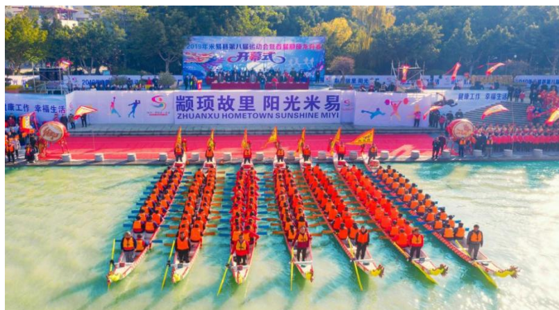
图3 颍项故里·阳光米易龙舟赛