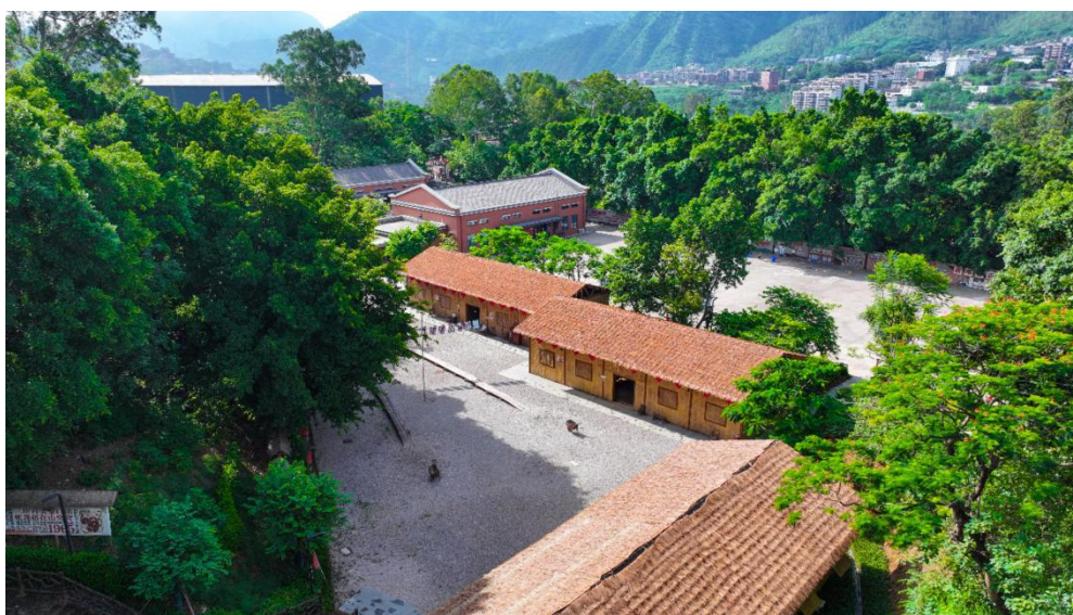
图1 火红年华席棚子

区风貌、特色餐饮等多元业态，对河门口历史建筑、街巷进行保护性修缮和活化利用，打造三线主题博物馆、纪念馆、特色书店、怀旧餐厅、文创工坊等消费场景，建成城市文化客厅与三线文化核心展示窗口。依托电视剧《火红年华》拍摄地及历史遗迹，打造沉浸式体验基地与爱国主义教育基地，再现三线建设时期的历史场景、奋斗故事与精神内核。