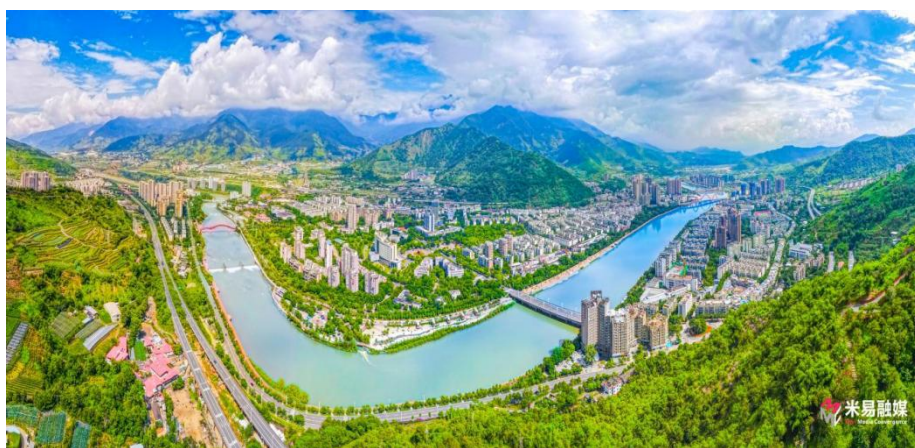
图 1 迷易湖全景图

迷易湖水利风景区位于米易县中心城区，2021 年获批为国家水利风景区。景区面积 11.21 平方公里，其中水域面积 1.61 平方公里，按照“一带四区”空间总体布局，以安宁河水文化风光带为中心，建成了草场河水生态修复区、小三峡生态游憩区、城市滨水休闲区、城南水上娱乐区，实现了人与自然和谐发展。依托安宁河两岸堤防、城北闸坝、城南电站、丙海水利枢纽以及草场河水系连通等重点水利工程，与安宁河、草场河、龙爪山等构成了“山水林田湖”的绿色生态屏障；高标准建成国家皮划艇激流回旋竞训基地、滨河景观长廊、易园等，推动治水兴水与城市发展相得益彰；迷易灯会、米