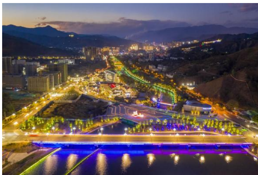
图3 中国苴却砚博物馆广场夜景

秉持“生态优先、因地制宜、便民利民”理念，推动生态修复成果转化为民生福祉与发展动能。投入4886.71万元建成占地3552.1平方米的大河广场，科学优化滨河空间功能布局，配套沥青健身步道、透水砖系统、彩虹标识道路，搭建全民就近健身休闲平台。深挖滨水夜间经济潜力，完善沿线亮化照明配套，丰富城市夜游场景；锚定智慧城市建设目标，推动城市精细化管理与智慧文旅深度融合，创新培育康养夜间文化新业态，持续集聚城市人气和商气，让滨水空间成为优化公共服务、丰富城市内涵、拉动城市繁荣的重要载体。