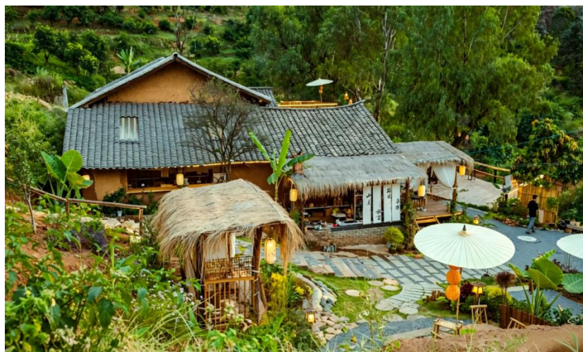
图 2 弄密村山见小院

化设计，避免“千院一面”。一是保留乡土底色。在改造过程中，优先保留老房屋的木梁、土墙、石板路等乡土元素，收集村民闲置的老农具、旧陶罐等作为庭院装饰，还原乡村的质朴风貌，让游客“记得住乡愁”。二是融入现代设计。引入简约美学理念，对庭院的门窗、露台、景观小品进行优化升级，增设休闲座椅、遮阳棚、灯光系统等设施，同时配套建设卫生厕所、污水处理设施，兼顾“颜值”与“实用性”，打造兼具乡土气息与现代舒适度的乡村空间。三是改善人居环境。推进人居环境整治，争取中央资金 4200 万元，地方专项债 3300 万元完善基础设施，建设生态步道、停车场等，投入 678 万元财政资金，对 4 公里产业主干道实施提质改造，发动村民对自家庭院进行改造升级，弄密村现有 153 户“美丽庭院”达标户，道路、庭院干净整洁，整体风貌焕然一新。