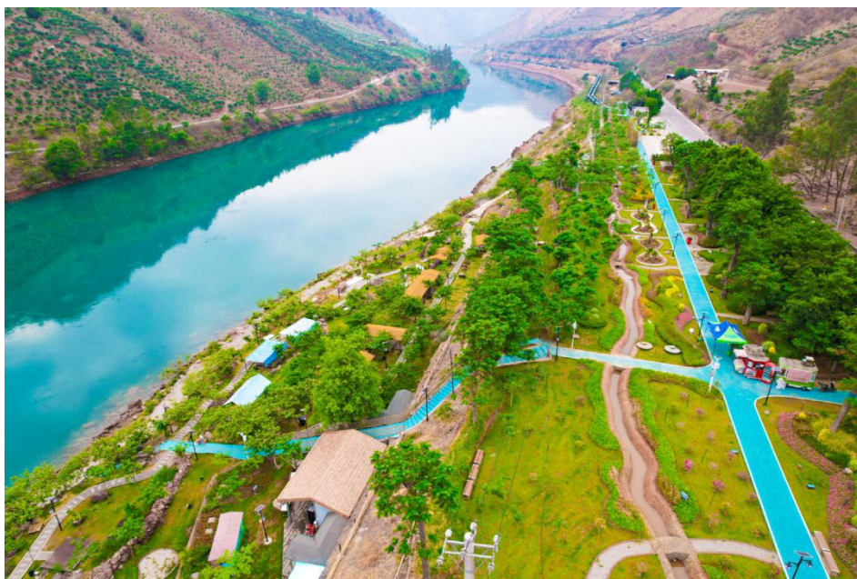
图6 水墨金沙景区

直接带动周边消费约900万元。火红年华项目开发的“西区有礼”“三线谱”钛制品等系列绿色文创成果屡获大奖,实现了生态与文化向高附加值品牌的精准转化,全面夯实了攀枝花“阳光花城”品牌的绿色发展底色。