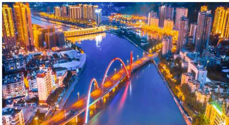
图4 迷易湖大桥夜景图

坚持将城市与水利风景区规划建设有机统一、深度融合，科学编制《米易县水资源综合规划》《米易县迷易湖水利风景区总体规划》等综合性规划，以新发展理念推进水利风景区规划建设，注重山水相融、人水和谐。通过迷易湖水利风景区建设，建成滨河景观长廊 9 公里、沿河健身绿道 15 公里，安宁河米易城区段水域面积达到 1000 余亩，形成了“美丽河湖、靓丽两岸”的城市景色，城市宜居品质显著提升，人民群众获得感幸福感不断增强。