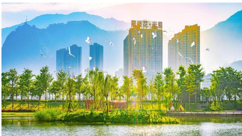
图 2 米易县城南湿地公园

聚焦城市河湖型水利风景区定位，注重山水相融、人水和谐，突出风景区生态优势，整合水利、城市建设、文化旅游、生态环保等资金 3.2 亿元，高标准建成水文化长廊、儿童沙滩公园、河滨公园等系列精品城市景观，打造梅溪谷湿地公园、城南生态湿地公园等 7 个主题公园，有力促进了水利风景区、生态功能区与城市发展建设有机融合，形成了“一水串城、山水交融”的城市发展格局。