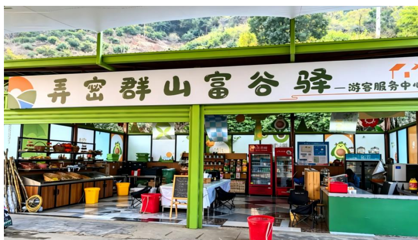
图4 弄密群山富谷驿

二是聚力多元共治，扮靓乡村环境。乡村改造坚守乡土底色、融入现代设计，差异化打造特色庭院，同时以产业发展为契机，争取资金完善基础设施、整治农村人居环境，通过农户美丽庭院建设+“合伙人”小院美化提升+乡村公共环境打造，促进了乡村整体风貌提升，实现产业发展与环境美化共同推进。