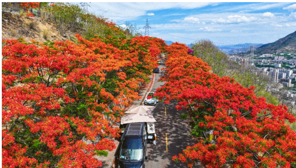
图5 西佛山凤凰花

业基地的记忆焕发新生,成为具有全省影响力的“艰苦奋斗教育基地”。“水墨金沙”带动村民全程参与建设管护,人均收入大幅提升。西佛山获评国家 AAA 级旅游景区,全面提升了全龄群体在“山水灵秀新城”建设中的获得感、幸福感与认同感。