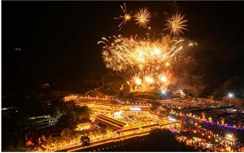
图6 芋见·张宜花园餐厅夜景