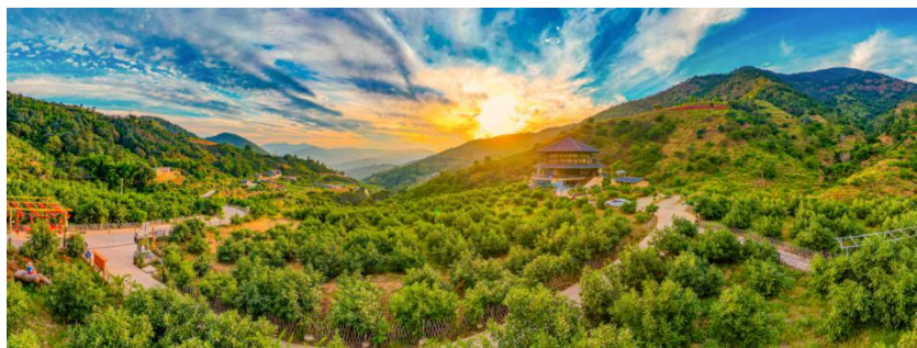
图 1 弄密村牛油果基地

习近平总书记强调，要扎实推进宜居宜业和美乡村建设，让农村既留住乡风乡韵，又焕发新的生机与活力，为乡村振兴注入动力。东区银江镇弄密村辖区面积 17.38 平方公里，现有村民 681 户 1735 人。全村拥有耕地 1586.9 亩、林地 26232.3 亩，产业以农业发展、交通运输为主，辖区内有企业 57 家、商户 91 家，建有牛油果现代农业观光园等重点项目。近年来，该村以“和美乡村”建设为统领，针对土地碎片化、集体资产闲置、发展资金短缺等核心问题，以发展“小院经济”为突破口，招引山见小院、致愚小院等业态加入，推出农业观光、休闲采摘、亲子手工等“研学+旅游”线路，年接待超过 10 万人次前来体验乡村旅游的乐趣。通过整合闲置资源、美化人居环境、丰富产业业态，推动农文旅深度融合，逐步呈现“村美、人和、业兴”的和美乡村新图景。