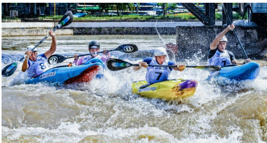
图6 全国皮划艇激流回旋锦标赛

水美乡村，带动周边群众发展乡村旅游，助推乡村全面振兴。米易县先后被评为美丽四川建设先行试点县、全省首批实施乡村振兴战略工作先进县、天府旅游名县。同时，充分利用水利风景区平台和窗口，挖掘景区文化内涵，讲好米易水利故事，“产业强”“生态优”“人文美”的城市形象日益彰显，实现了生态效益、经济效益和社会效益有机统一。