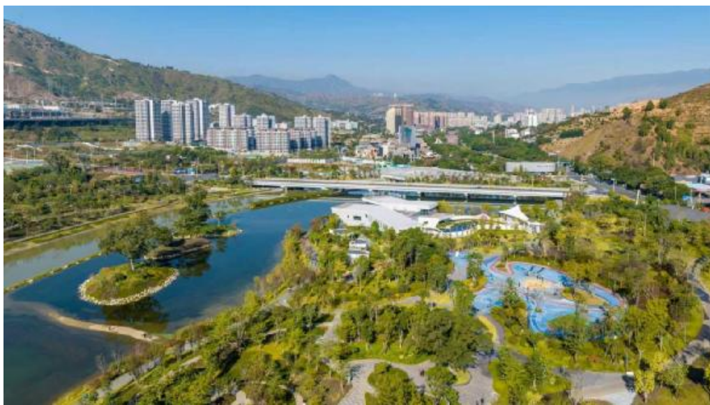
图2 水中央湿地公园全景

坚持治污先治本、提质先提基，完善管网、蓄水、治理设施等基础设施体系，筑牢治水硬件支撑。投资3176.57万元在大河路歇桥上段新建橡胶坝3个、隐形堤625.3米，抬高大河上游水位，为打造城市河道景观提供基础保障；新建排污管2125.82米，扩大城市污水管网覆盖面积，提升城区生活污水集中收集处理率。提能升级仁和第一污水处理厂配套设施和大河两岸沿线主次管网15公里，提升污水处理能力，实现大河沿岸的生活污水应收尽收，切实保护大河水环境。